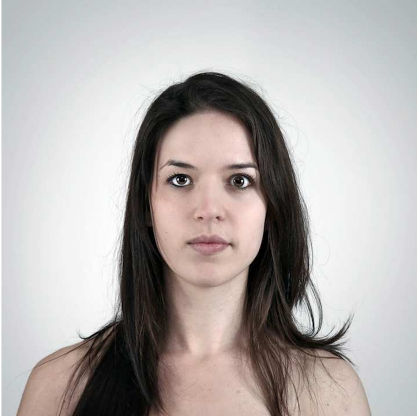
دو خواهر ۲۳ و ۲۹ سال