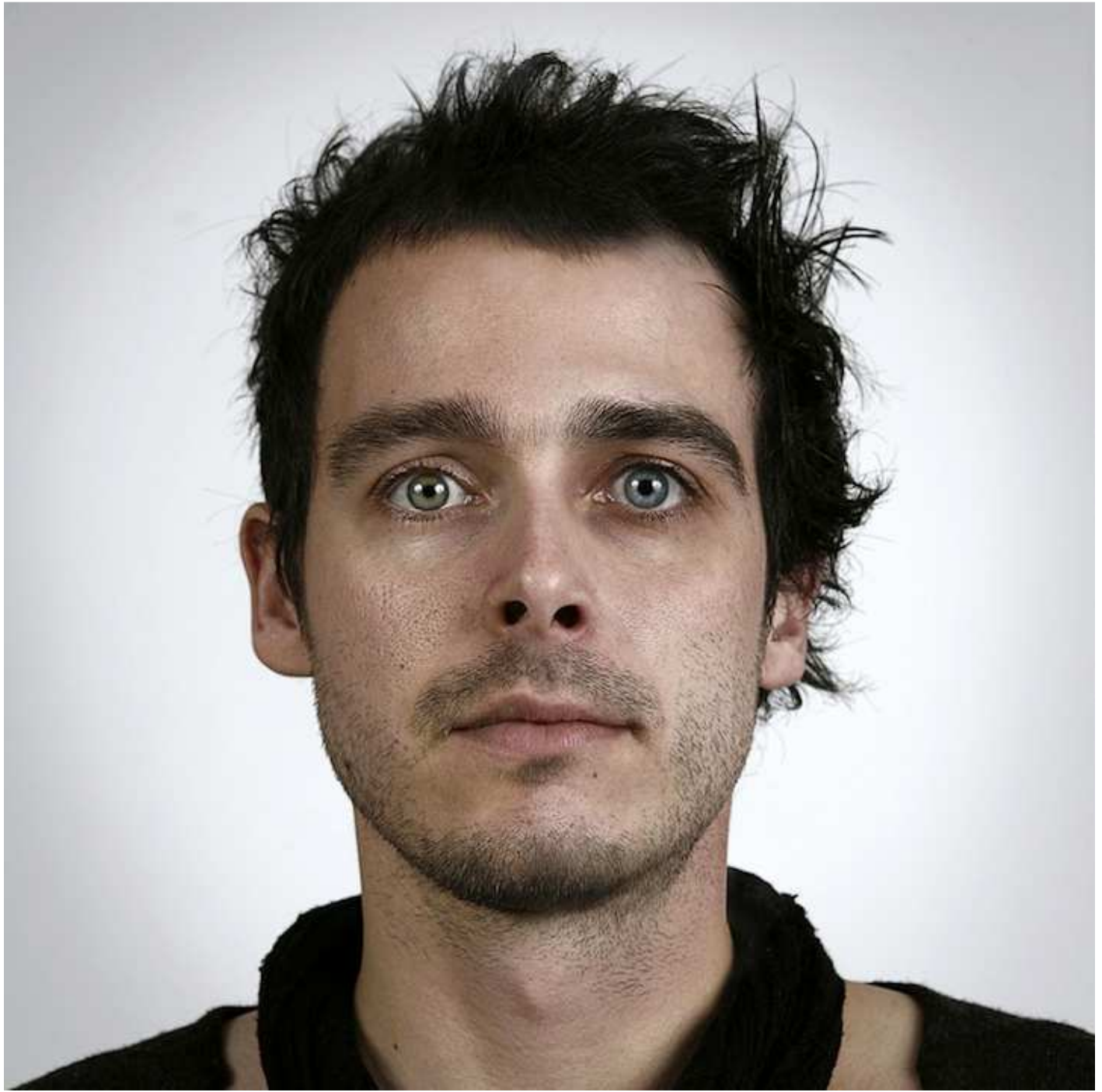
دو برادر ۲۹ و ۳۲