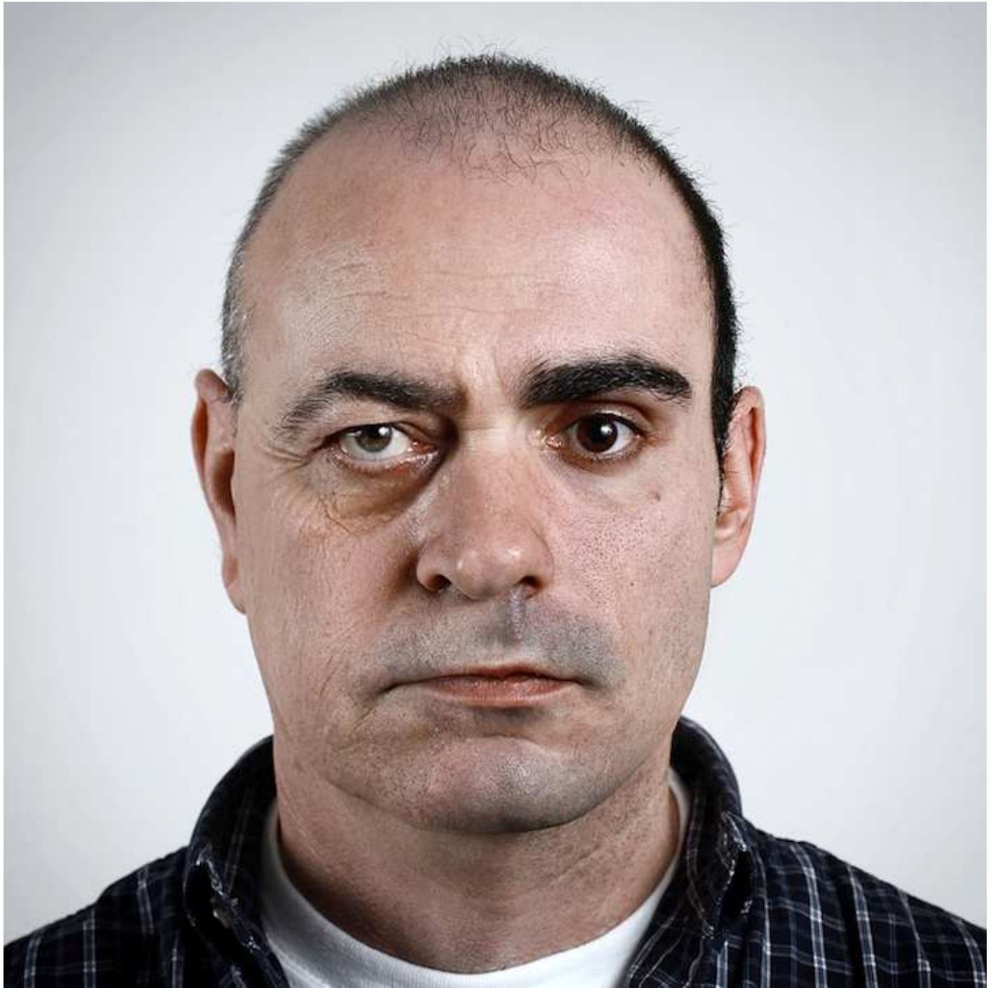
پسر ۲۹، پدر ۵۶ سال